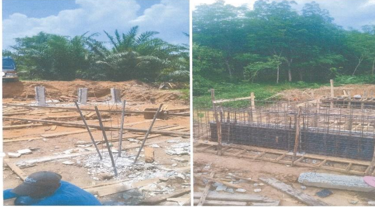
ภาพถ่ายระหว่างดำเนินการ